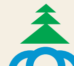
SCHÉMA INFORMAČNÉHO SYSTÉMU NAKLADANIA S ŤAŽOBNÝM ODPADOM

MINISTERSTVO ŽIVOTNÉHO PROSTREDIA SLOVENSKEJ REPUBLIKY